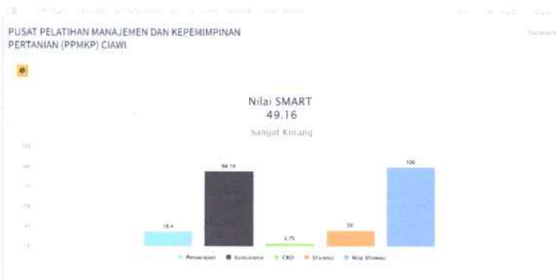
Gambar 3.1 Nilai Kinerja Anggaran Triwulan I

Persentase capaian kinerja anggaran tahun 2023 triwulan I sebesar 49.16 Berdasarkan aplikasi monev kinerja anggaran PMK 249/2011 diatas, secara singkat dapat dijelaskan sebagai berikut :