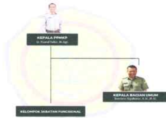
Gambar 1.1. Bagan Struktur Organisasi PPMKP

Berikut adalah bagan struktur organisasi PPMKP, terlampir di Gambar 1.1.