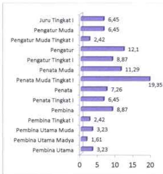
Gambar 1.2. Diagram Kepangkatan Pegawai PPMKP Ciawi tahun 2023